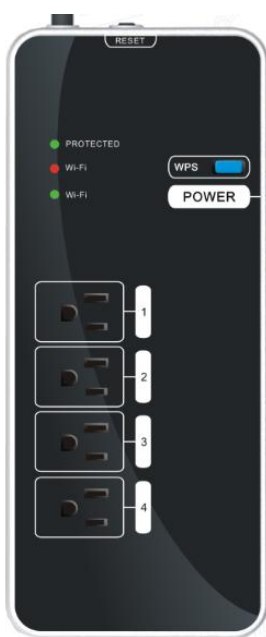
今回試作開発した iRemoTap